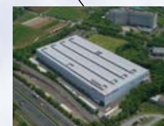
■中井工場 (神奈川県) ISO 14001 登録 登録番号: JSAE 283 ISO 9001 登録 登録番号: JSAQ 860