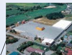
■高畠事業所 (山形県) ISO 14001 登録 登録番号: JSAE 283 ISO 9001 登録 登録番号: JSAQ 1316