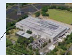
■つくば事業所 (茨城県) ISO 14001 登録 登録番号: JSAE 283 ISO 9001 登録 登録番号: JSAQ 2763