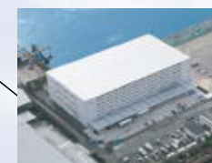
■鶴見工場 (神奈川県) ISO 14001 登録 登録番号: JSAE 283 ISO 9001 登録 登録番号: JSAQ 630