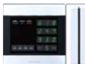
磁気カードリーダー