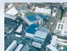
■(株)関西オカムラ(大阪府) ISO 14001 登録 登録番号: JQA-EM 0459 ISO 9001 登録 登録番号: JQA 2484