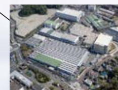
■追浜事業所 (神奈川県) ISO 14001 登録 登録番号: JSAE 283 ISO 9001 登録 登録番号: JSAQ 630