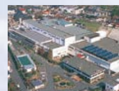
■(株)山陽オカムラ(岡山県) ISO 14001 登録 登録番号: JQA-EM 1166 ISO 9001 登録 登録番号: JQA-QM 3753