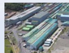
■(株)エヌエスオカムラ(岩手県) ISO 14001 登録 登録番号: JQA-EM 1618 ISO 9001 登録 登録番号: JQA-QM 4055