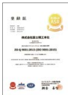
ISO 9001:2015認証 No.Q4639

常にお客さまのニーズを的確に把握した製品の開発、提供に努め、さらなる品質向上を目指しています。最新鋭の設備と創業以来培われた技術から生産される製品は、各方面から確かな信頼を得ています。