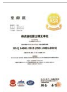
ISO 14001:2015認証 No.E2135

「循環型社会」をキーワードに、さらなる「環境マインド」と「環境経営度の向上」を目指して、継続的改善に努めていきます。