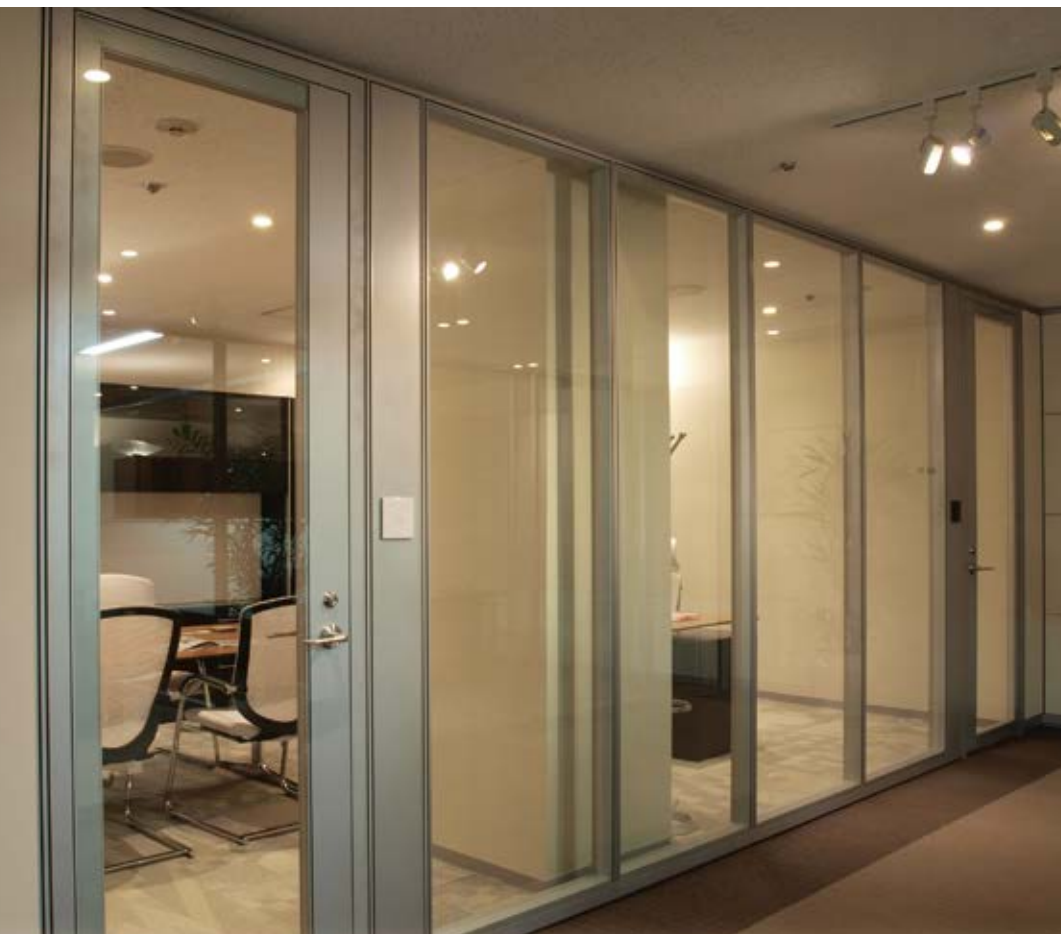
入退室管理システム

金庫室扉の製造技術を生かし、高性能の防水、防音、防盜、防火などの目的に応じた扉を製造し、施工、保守まで一貫して行うことで、厚い信頼を得ています。また、博物館の収蔵庫扉、保管庫扉など、特殊扉も製造、納入しています。