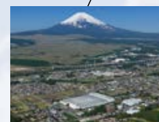
■富士事業所 (静岡県) ISO 14001 登録 登録番号: JSAE 283 ISO 9001 登録 登録番号: JSAQ 2764