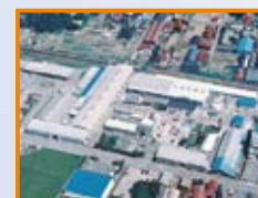
■(株)富士精工本社(石川県) ISO 14001 登録 登録番号: E2135 ISO 9001 登録 登録番号: Q4639