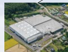
■御殿場事業所 (静岡県) ISO 14001 登録 登録番号: JSAE 283 ISO 9001 登録 登録番号: JSAQ 2765